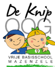
De Knipoo Mazenzele