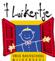
't Luikertje Nijverseel