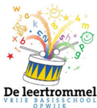
De Leertrommel Opwijk