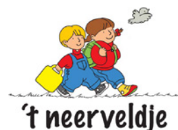
Kleuterschool 't Neerveldje Opwijk