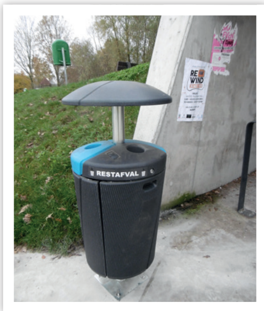
Nieuwe grote vuilnisbak – skateterrein Hof ten Hemelrijk.

De Phoenix–vuilnisbakken zijn gemaakt van gerecycleerde kunststof en tellen drie afvalbakken, telkens met een inhoud van 50 liter. Bovendien heeft elke vuilnisbak, boven aan de zwarte afvalbak, nog een apart ingewerkt bakje voor gedoofte sigarettenpeuken. Sigaretten kan je gemakkelijk