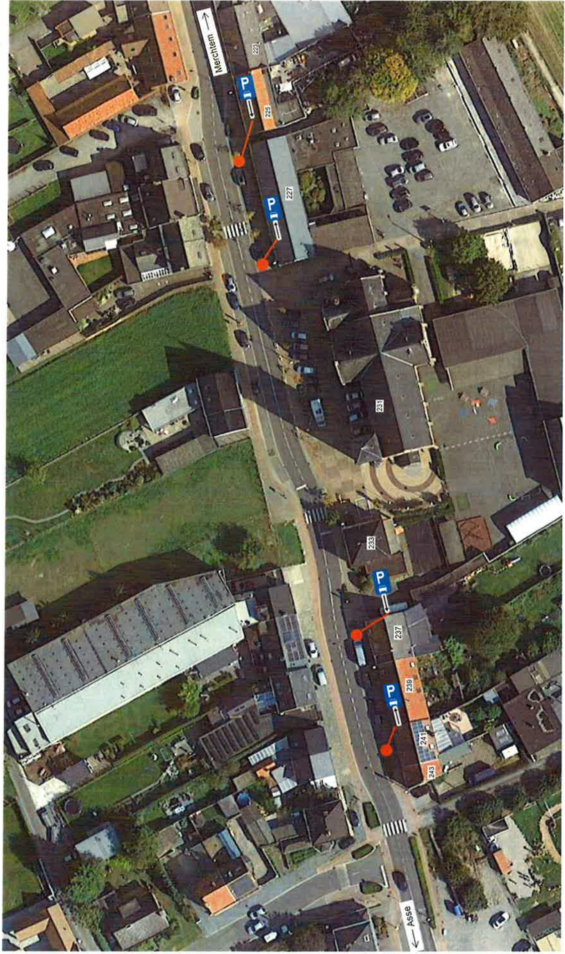
N211 – Stwg op Vilvoorde thv huisnummers 227 – 243 (doortocht Droeshout)