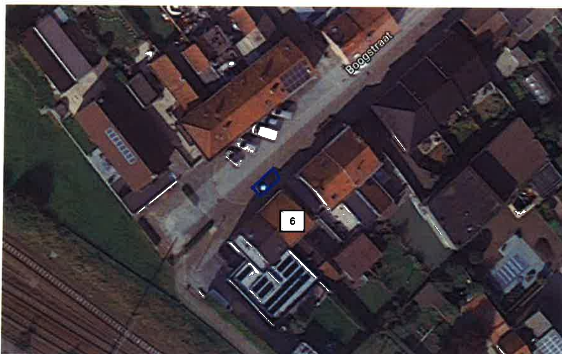
Boogstraat, parkeerplaats minder valide, thv nr. 6